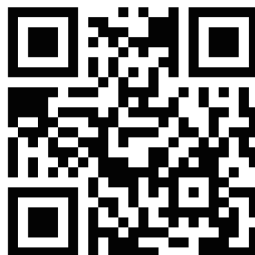
ログイン QR コード